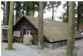
復元された三角兵舎(特攻平和会館隣)