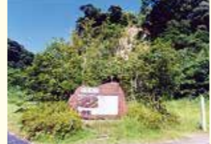
写真は、「知覧城跡」の説明石碑になります。

航空機は精密機械のようなもので常時の日常点検と定期的なオーバーホールが必要です。 分廠ではオーバーホールや故障機の修理、補給部品の製作など難易度の高い整備を行いました。