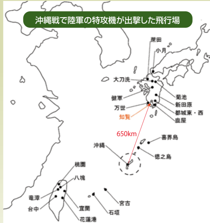
知覧飛行場位置図